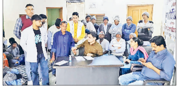
चरखी दादरी। शिविर में मरीजों की जांच करते चिकित्सक।

जनसेवा संस्थान परिसर में दिव्यांगजनों के लिए चिकित्सा शिविर का आयोजन