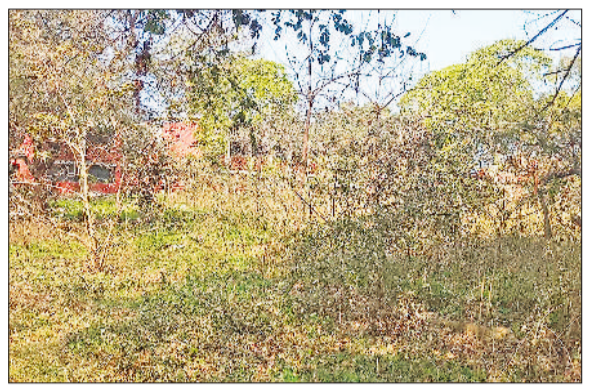
भिवानी। तहसील परिसर में उगी झाड़ियों का दृश्य तथा सफाई की मांग को लेकर सौंपते ज्ञापन।

नीचे व्यक्तिगत शौचालय है। बाहर कार्य कर रहे वकील वसोिकानवीस तथा टाईपिस्ट तथा उनके पास या तहसील प्रांगन में आये आमजन की तकलीफ से उनको कोई लेना नहीं है, पुरुष खुले में जाये औरतों को उनके हाल पर छोड़ देते हैं। अधिकारी व कर्मचारी इस ओर कोई ध्यान नहीं दे रहे हैं। तहसील कर्मचारियों की कार्यप्रणाली को लेकर क्षेत्र के लोगों में भारी रोष है। तहसील परिसर बार