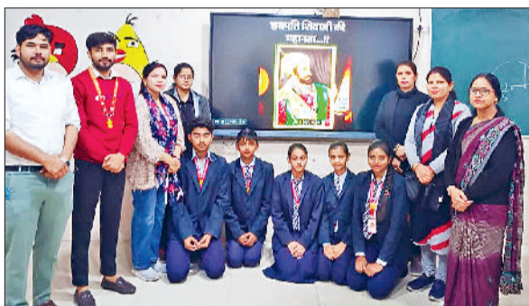
चरखी दादरी। महान राष्ट्र नायक छत्रपति शिवाजी को नमन करते शिक्षक व विद्यार्थी।

चरखी दादरी। परसराम हेतराम स्कूल में महान राष्ट्रनायक छत्रपति शिवाजी महाराज जयंती अत्यंत श्रद्धा, उत्साह और देशभक्ति के भाव के साथ मनाई। कार्यक्रम का शुभारंभ शिवाजी महाराज के चित्र पर पुष्पांजलि अर्पित कर एवं द्रौप प्रज्वलन के साथ किया। कार्यक्रम में विद्यार्थियों ने भाषण, भावपूर्ण कविता-पाठ, देशभक्ति गीत तथा प्रेरक लघु नाटिका की मनमोहक प्रस्तुतियां दीं। विद्यार्थियों ने शिवाजी महाराज के साहस, नेतृत्व क्षमता और अडिग संकल्प को अपने जीवन में अपना