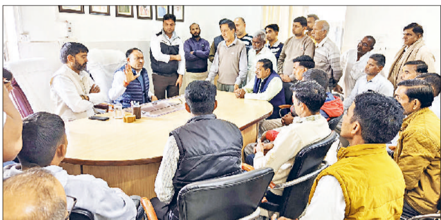
बवानीखेड़ा। नगर पालिका कार्यालय में विधायक कपूर वाल्मीकि व नपा प्रधान सुंदर अत्री के समक्ष समस्या रखते हुए दुकानदार व रिहायशी इलाके के लोग।

बवानीखेड़ा की नगर पालिका द्वारा शहर में खसरा नंबर 637, 639 व 640 में करीबन 12 एकड़ भूमि की 272 नई व पुरानी प्रॉपर्टी आईडी (पीआईडी) को रट कर वक्फ बोर्ड के नाम करने को लेकर क्षेत्रवासियों ने विधायक से मुलाकात की और समाधान की मांग की। क्षेत्रवासी उपरोक्त पीआईडी के संबंध में काफी चिंतित हैं और उनकी रातों की नींद उड़ी हुई है। क्षेत्रवासियों ने विधायक व चेयरमैन से मुलाकात कर अपना पक्ष रखा और समाधान की मांग की। उल्लेखनीय है जो 272