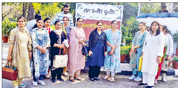
भिवानी। चंडीगढ़ में मुख्यमंत्री निवास संत कबीर कुटीर पर मुख्यमंत्री से मिलने पहुंची विभिन्न जिलों से नर्सिंग अधिकारी।

साथ ही नीति में बदलाव के लिए सुझाव भी दिए, क्योंकि नर्सिंग केंद्र में 95 प्रतिशत महिलाएं ही हैं। प्रदेश के विभिन्न जिलों से आई नर्सिंग ऑफिसर्स ने