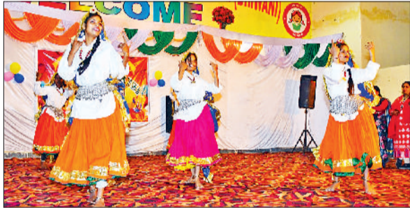
तोशाम। हरियाणवी नृत्य की प्रस्तुति देती छात्राएं।